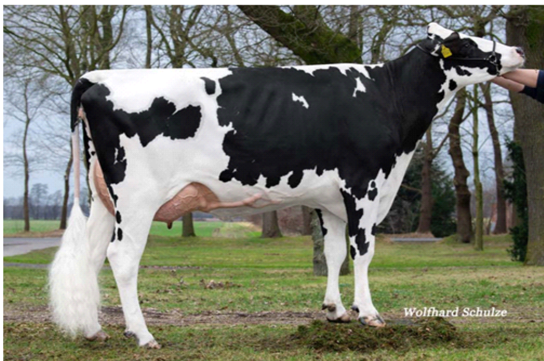
SKYFALL la madre NAIRA in prima lattazione